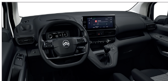
Interiér Látka LINE Šedá - OFFT