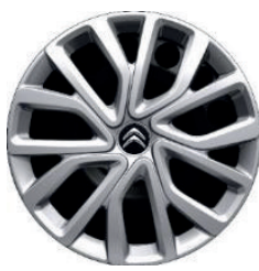
Okrasný kryt TWIRL R16 - černý střed