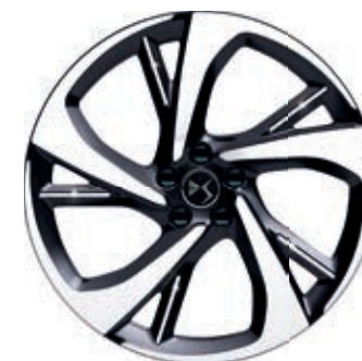
Hliníkový disk 20" TOKYO