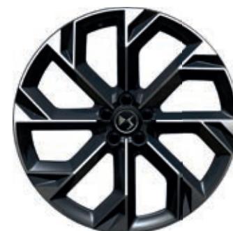
Hliníkový disk 21" BROOKLYN