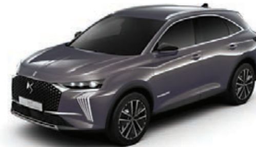
šedá NIGHT FLIGHT (M) M0A1