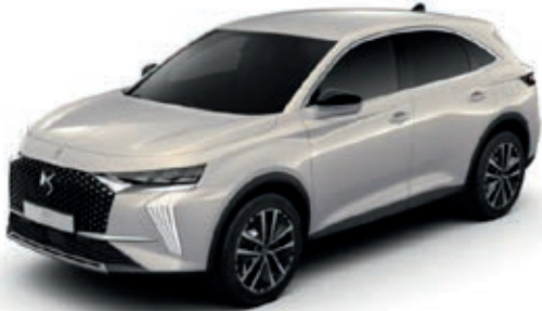
Bílá CRISTAL PEARL (M) M0PH