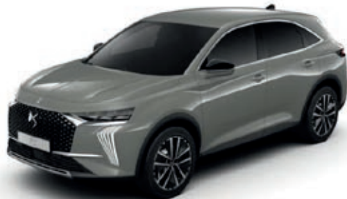
Šedá LACQUERED (M) M0SC