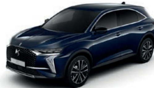
Modrá SAPHIR (M) M06L