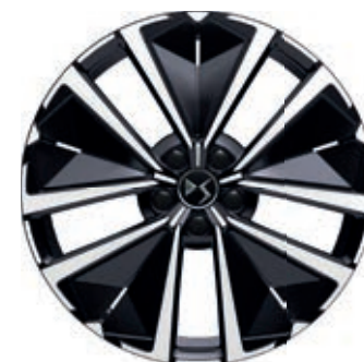
Hliníkový disk 19" EDINBURGH

Je elektronicky řízené odpružení se třemi módy: Sport / Normal / Comfort. V módu Comfort kamera umístěná pod čelním sklem analyzuje silnici před vozem v rozsahu 5 – 20 m, další senzory monitorují pohyby a parametry vozu. Na základě takto získaných údajů elektronika s předstihem upravuje průtok oleje v tlumičích, aby zajistila co možná nejhladší průjezd přes nerovnosti. Mód Comfort Camera je funkční v rychlostech cca 15 – 130 km/h, nefunguje ve tmě nebo při snížené viditelnosti (husté sněžení a podobně). Při nastartování vozu je odpružení automaticky vždy v módu Normal.