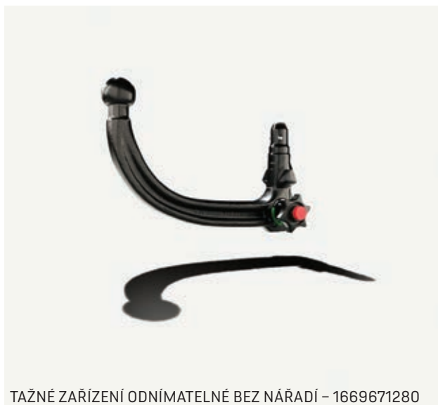
TAŽNÉ ZAŘÍZENÍ ODNÍMATELNÉ BEZ NÁRADÍ – 1669671280