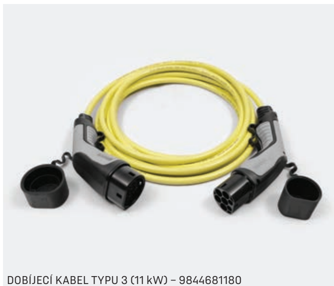
DOBÍJECÍ KABEL TYPU 3 (11 kW) – 9844681180